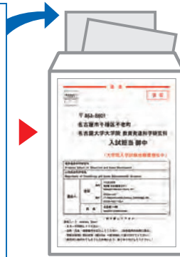
出願書類提出用宛名シート